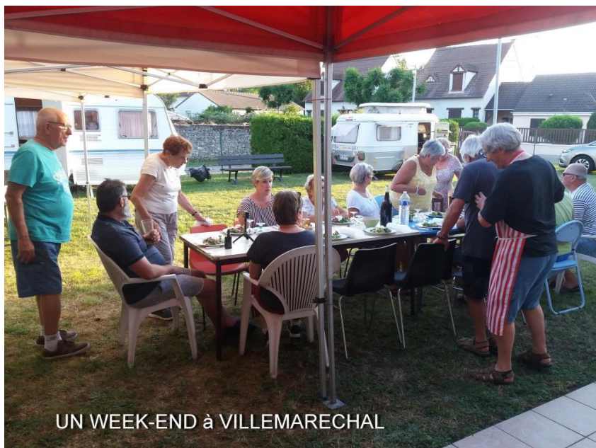
UN WEEK-END à VILLEMARECHAL