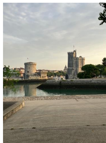
Les tours du port de La Rochelle