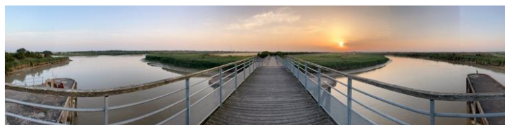
La Sèvre Niortaise

Jour 3. La journée s'annonce très chaude. Dès 10h il fait déjà trop chaud, je fais des pauses très souvent, le GPS annoncera jusqu'à 45°C.