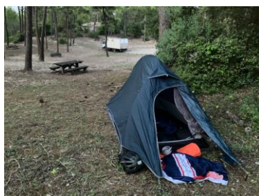
Bivouac à St-Jean-de-Monts

Jour 3. La journée s'annonce très chaude. Dès 10h il fait déjà trop chaud, je fais des pauses très souvent, le GPS annoncera jusqu'à 45°C.