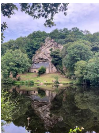
>>> Chapelle St-Gildas sur les bords du Blavet